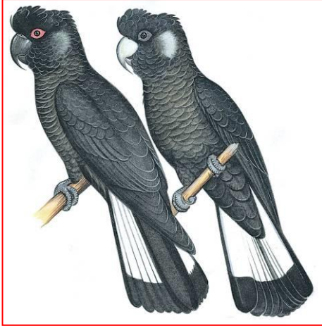
Maschio (sinistra), Femmina (destra)