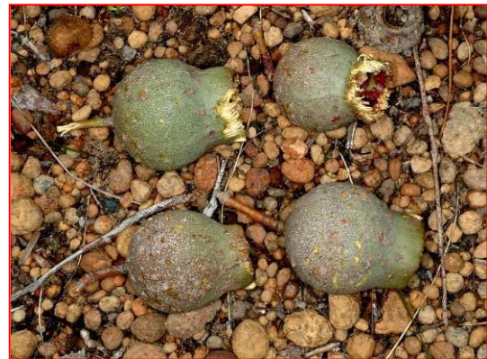
Noci di Marri mangiate dal Cacatua di Baudin

Images: Tony Kirkby Impaginazione: Kim Sarti Traduzione: Alessandra Giacchi